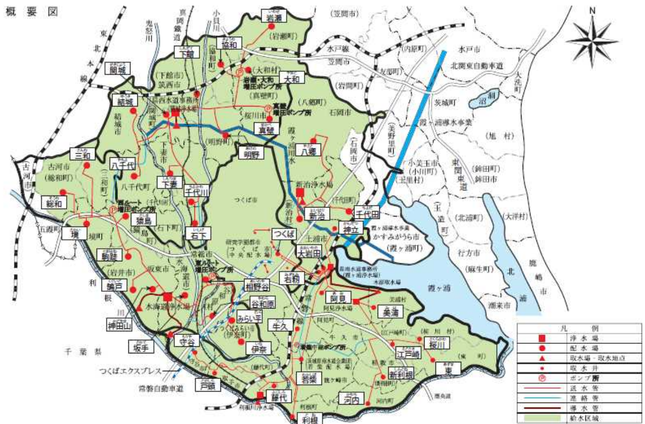
図-1 県南西広域水道用水供給事業