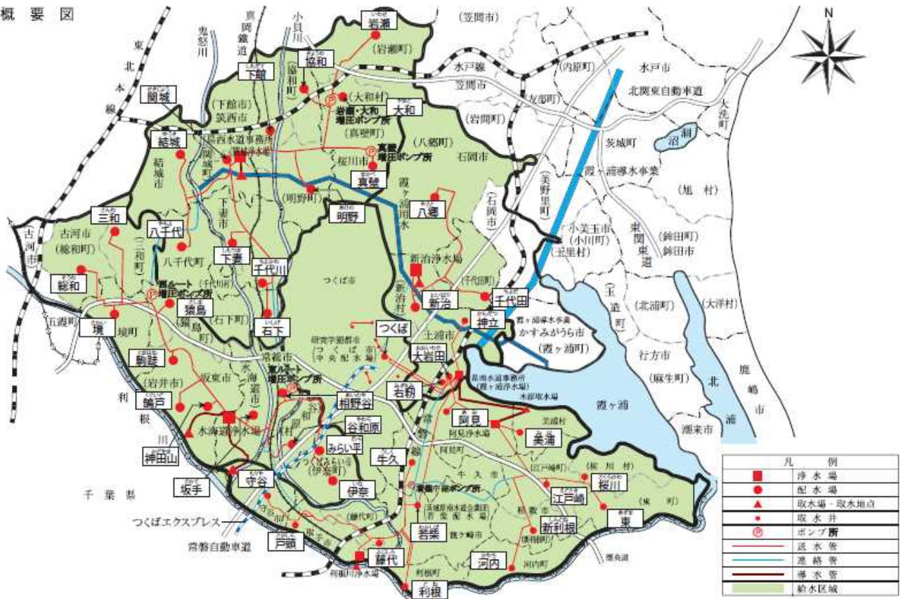
図-1 県南西広域水道用水供給事業